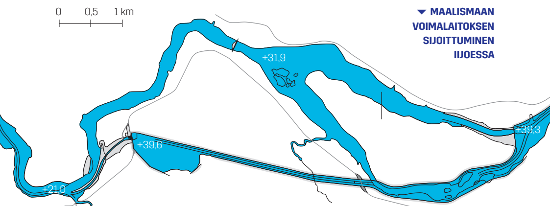
▼ MAALISMAAN VOIMALAITOKSEN SIOITTUMINEN IJOESSA