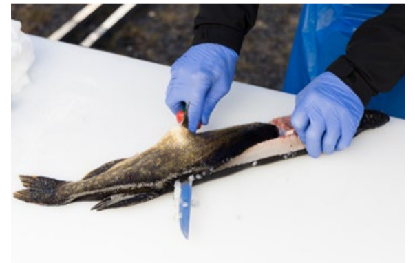
Haukifestareilta saa vinkit kalan oikeaoppiseen käsittelyyn.