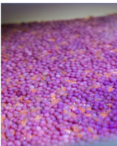
Silmäpisteasteen saavuttanut mäti värjätään. Näin kalanviljelylaitokselta peräisin oleva mäti ja kalat voidaan erottaa luonnossa syntyneistä. Väri säilyy kalojen luutumissa läpi kalan eliniän.