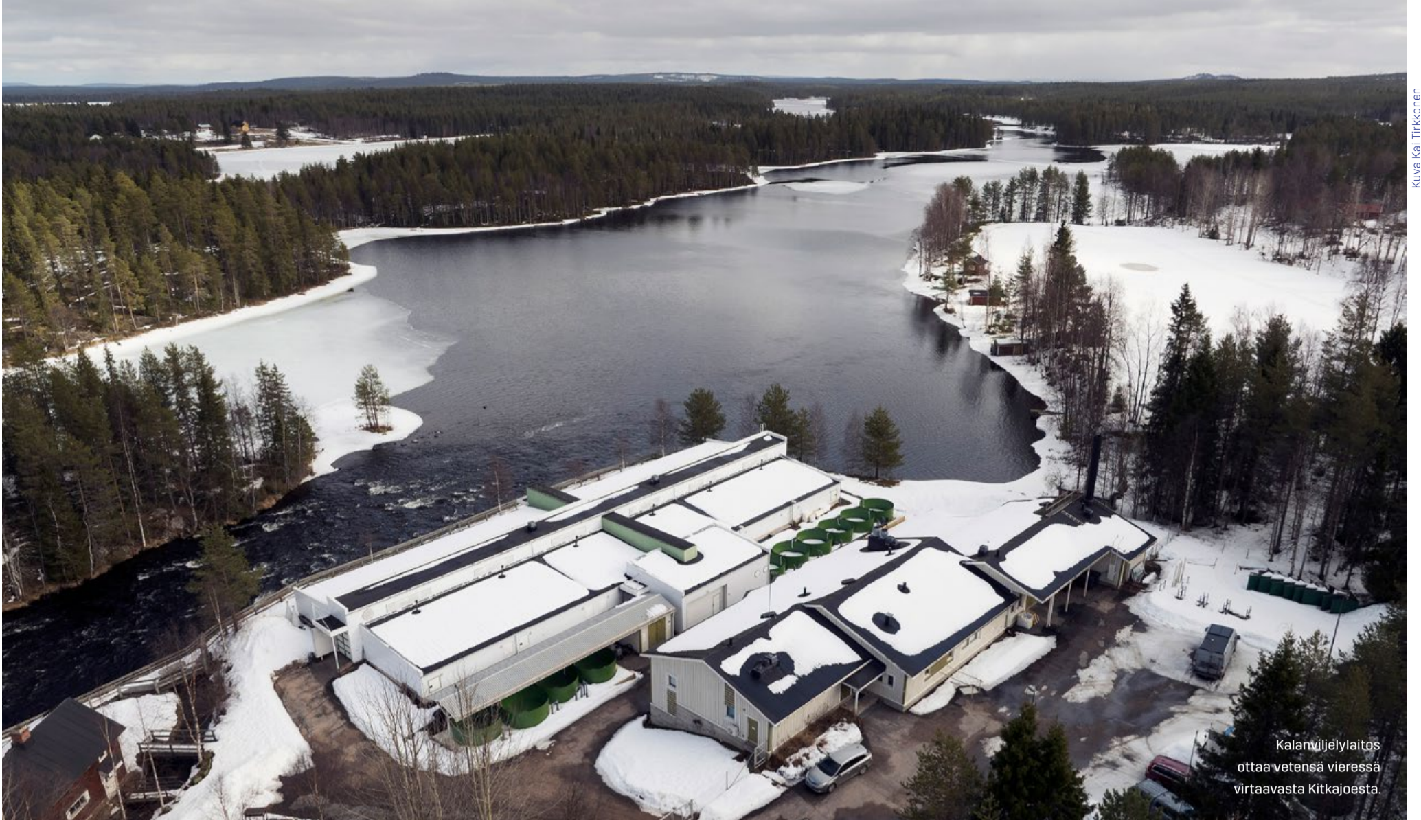
Kalanviljelylaitos ottaa vetensä vieressä virtaavasta Kitkajoesta.